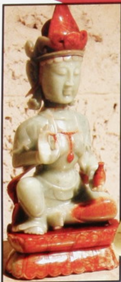
Bellas esculturas de jade