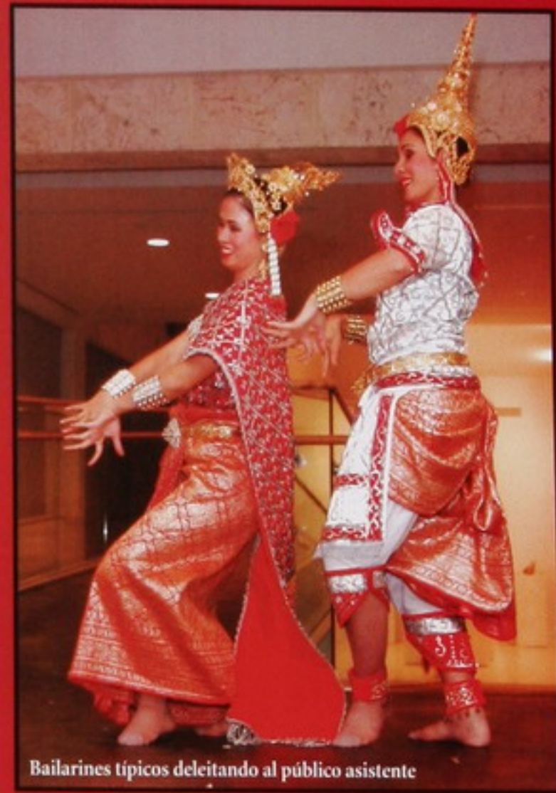
Bailarines típicos deleitando al público asistente