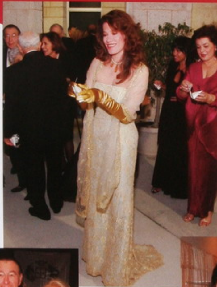
Momento en que la Princesa Thi-Nga, siguiendo un ritual de su natal Vietnam, suelta un bella mariposa después de pedir un deseo